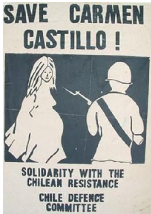
Comité Internacional de Solidaridad con Carmen Castillo