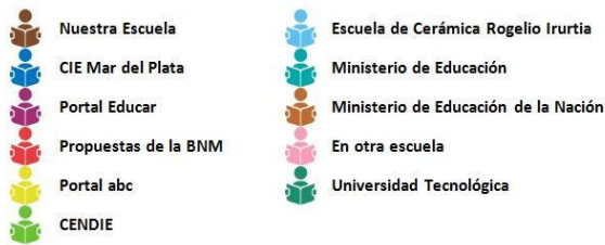
Figura 2. Instituciones elegidas para realizar cursos

Hay una gran variedad de cursos que los profesionales han indicado que realizaron, lo cierto es que la identificación ha sido muy dificultosa ya que no recordaban los nombres, por lo que se ha desarrollado un orden de temas de acuerdo a la asistencia de los mismos que se puede visualizar en la Figura 3. El Postítulo de Especialización Docente de Nivel Primario en Educación y TIC es la capacitación más realizada, ya que 12 de los 37 profesionales lo han cursado. Además de esta especialización, se debe indicar que 10 bibliotecarios han finalizado la Capacitación en el Software de Gestión Aguapey para Bibliotecas escolares dictada por el Cendie.