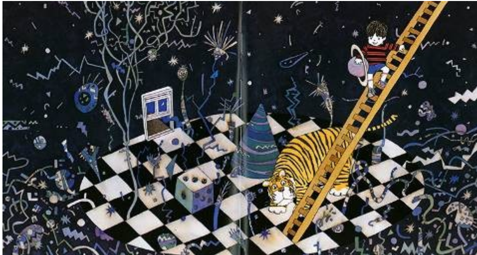
En el desván de Hiawyn Oram y Satoshi Kitamura

abajo, ordenada, condicionada, previsible como se da en las novelas decimonónicas y en cambio se asemeja a la lectura en pantalla: los ojos van y vienen, suben, bajan, vuelven a subir. El recorrido de los ojos del lector en estos libros es aleatorio, inesperado, subjetivo. Hay un nuevo lector que toma recursos de los dibujos animados, de los videojuegos, del cine porque las nuevas producciones le llevan a buscar esos recursos.