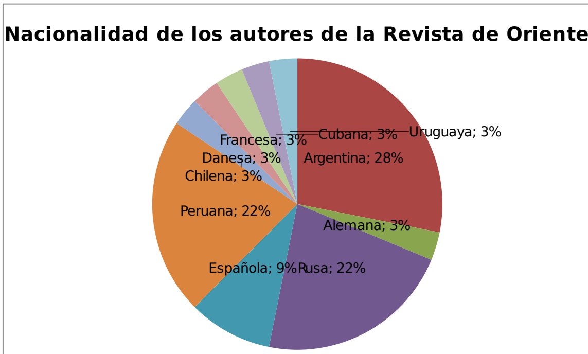
Grafico 1: Nacionalidad de los autores de la Revista de Oriente.

En Revista de Oriente los intercambios con la U.R.S.S. se evidencian en cada una de las páginas, lo cual permite determinar que este proyecto editorial funciona como red intelectual no solo latinoamericana, como muchas otras de las revistas, sino que traspasa esta frontera y logra ofrecer un amplio espectro de distintos documentos, literarios e informativos, rusos. Son importantes las cartas que aparecen en la publicación de Anatole Lunatcharsky o de Haya de la Torre. Este tipo de apariciones en la revista le otorga legitimidad frente a otras. Por ejemplo, Haya de la Torre sostiene: