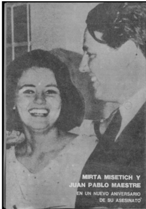
De frente con las bases peronistas, Nº10, 18 de Julio de 1974.