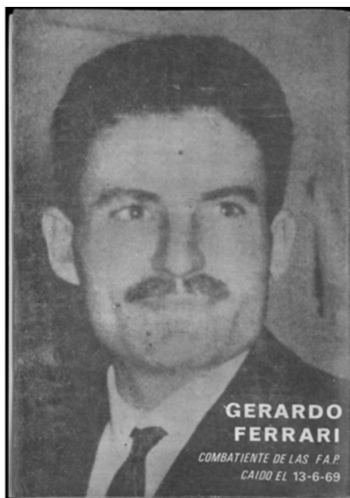
De frente con las bases peronistas, Nº8, 27 de Junio de 1974.