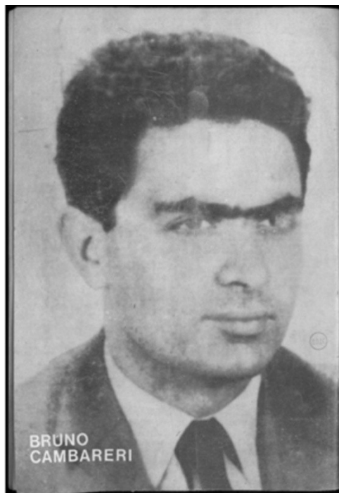
De frente con las bases peronistas, Nº6, 12 de Junio de 1974.