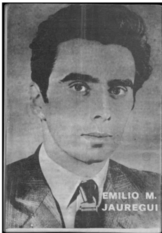
De frente con las bases peronistas, Nº7, 20 de Junio de 1974.