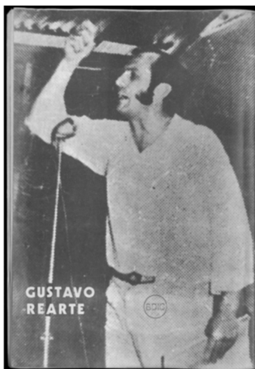
De frente con las bases peronistas, Nº4, 23 de Mayo de 1974.