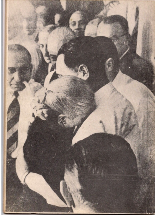
De frente con las bases peronistas, Nº9, 11 de Julio de 1974.