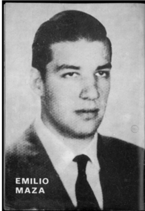
De frente con las bases peronistas, Nº5, 30 de Mayo de 1974.