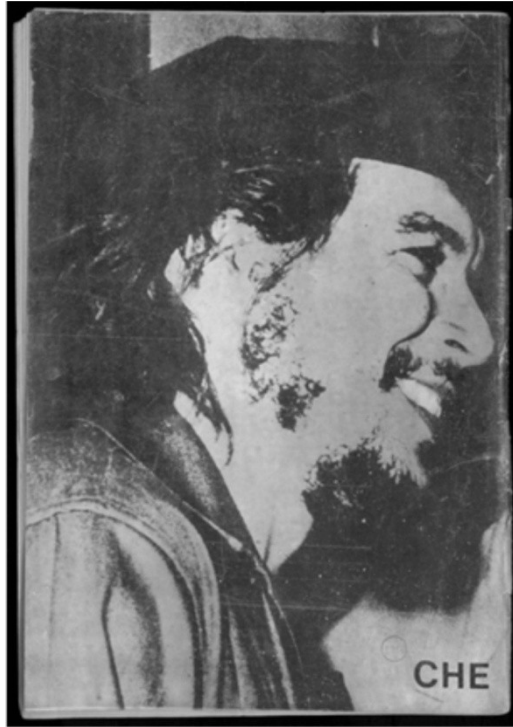
De frente con las bases peronistas, Nº11, 25 de Julio de 1974.