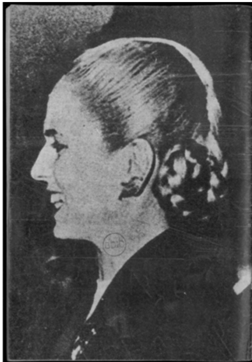
De frente con las bases peronistas, Nº2, 9 de Mayo de 1974.