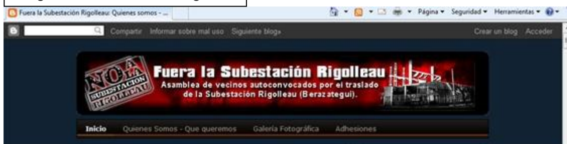
Imagen 1: Encabezado del Blog

En el blog incluyen un encabezado sobre un lúgubre fondo negro y con manchas rojas las leyendas “ No a la Subestación Rigolleau ” “ Fuera la Subestación Rigolleau, Asamblea de vecinos autoconvocados por el traslado de la Subestación Rigolleau (Berazategui) ”. El texto en blanco y negro, que matiza con los colores de fondo, ocupa dos tercios del encabezado anclando fuertemente en la pequeña imagen de la subestación ubicada hacia el límite derecho del blog, a tal punto que da la impresión que fuera a salirse de foco. Una estrategia interesante