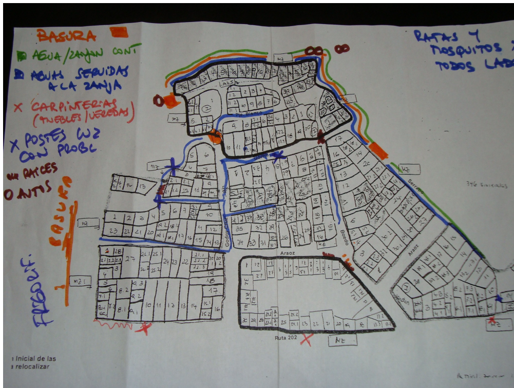
Figura 3: Croquis del barrio con los riesgos ambientales identificados por los delegados

Al 2012 se han realizado a través del programa de Mejoramiento de barrio obras de infraestructura (como la red de desagües cloacales, la red de desagües pluviales, la normalización de la red de agua potable) y obras de equipamiento urbano (tales como la construcción de veredas y pavimentos, el tendido de alumbrado público y el acondicionamiento de espacios verdes). Además, el Municipio de San Fernando ha normalizado el servicio de recolección de residuos, eliminando en su mayoría los focos de basura identificados en los primeros encuentros en el barrio. En este sentido, y teniendo en cuenta que se trata de un proceso de urbanización, vale la pena considerar qué riesgos aún permanecen en el barrio más allá de las mejoras alcanzadas.