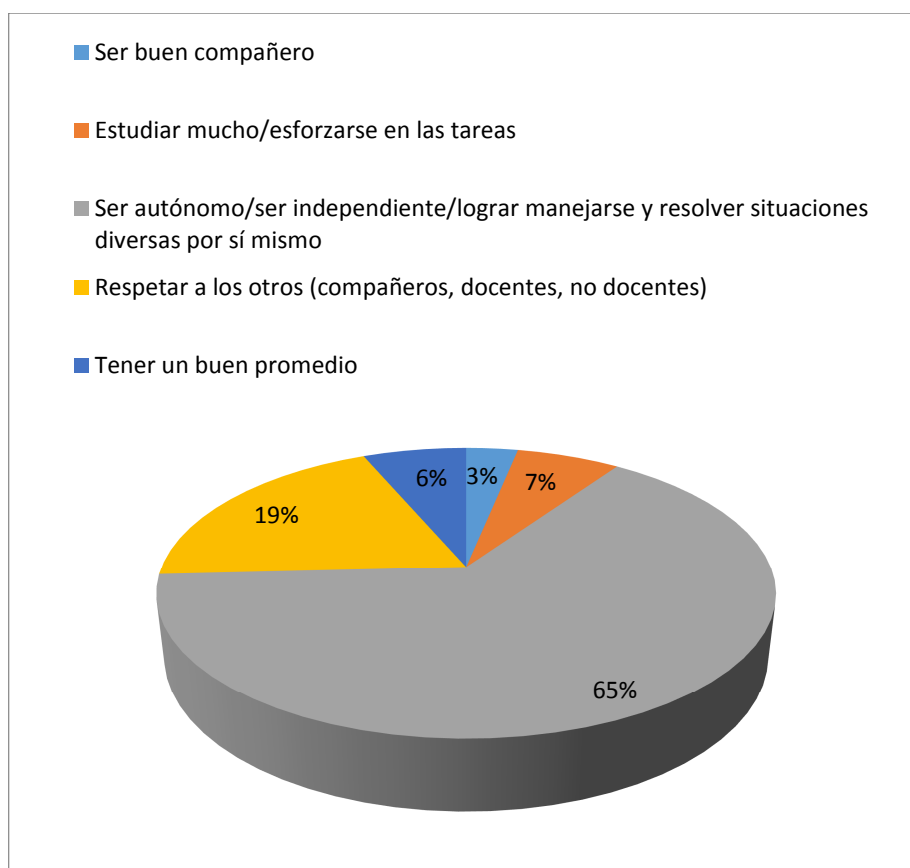
Gráfico 1. Escuela 1. Aspectos que definen a un “buen estudiante”

Los gráficos que presentamos a continuación exhiben, agrupadas en porcentajes, las respuestas de los docentes cuando les solicitamos que definieran a un buen estudiante de la escuela. En el caso de la Escuela 1: