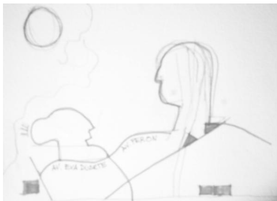
Figura N°1: San Petersburgo, Puerta de Hierro, Las Achiras y Almaguer situados según indican las manchas oscuras sobre la ciudad jardín, Ciudad Evita y el inconcluso barrio Teniente General Domingo Perón.