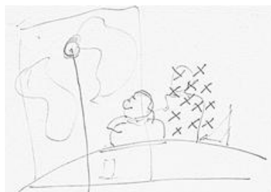
Figura N° 2: La silueta de Perón tachada con la Urbanización del Barrio BID.