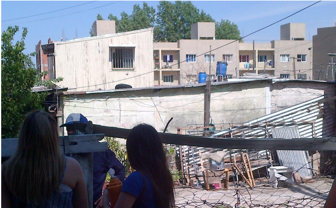
Figura N° 7: Los Eucaliptus. Foto estudiantes Universidad Nacional Arturo Jauretche, 2014.

Algunos NHT han quedado como parte de una historia pasada. Se han convertido en barrios con colores, texturas, formas que otorgan un nuevo carácter simbólico. Son la expresión de gestiones democráticas, comunitarias, participativas, con la alegría de cumplimentar el derecho a la vivienda de los habitantes.