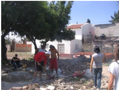
Imagen N° 6: Villa Palito, 2006. Demoliciones del NHT a cargo de la Cooperativa de Trabajo constituida por los jóvenes del Barrio. Foto Juan Enríquez.

Barrio Almafuerde en 2004 comienza la intervención sobre el NHT a través del Programa Federal de Emergencia Habitacional, el Mejor Vivir para los Mejoramiento Habitacionales o Ampliaciones y la regularización dominial a través de la Comisión Nacional de Tierras, articulándose con el Programa de Mejoramiento de Barrios que hasta ese momento solo se implementaba en el terreno contiguo.