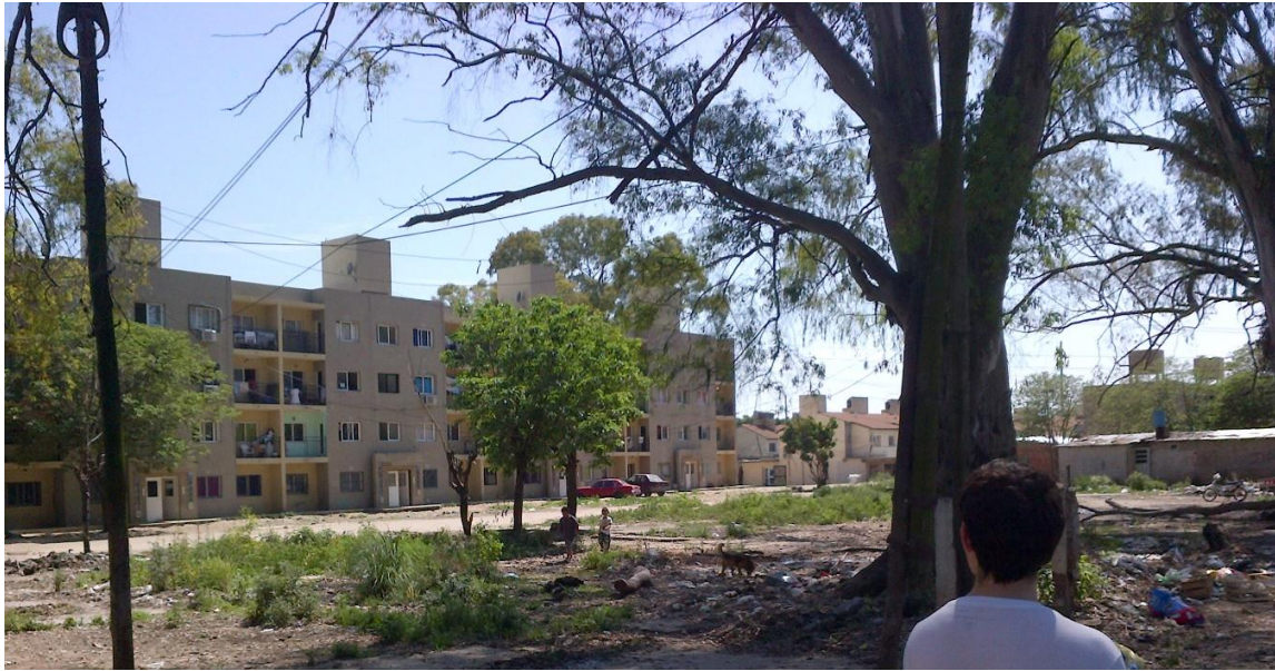
Figura N° 8: Los Eucaliptus. Foto estudiantes Universidad Nacional Arturo Jauretche, 2014.

La intervención sobre los NHT ha significado una operación compleja en tanto retoma las acciones inconclusas basadas en paradigmas de traslados compulsivos provenientes de tiempos de terrorismo de estado en los que la población fue avasallada.