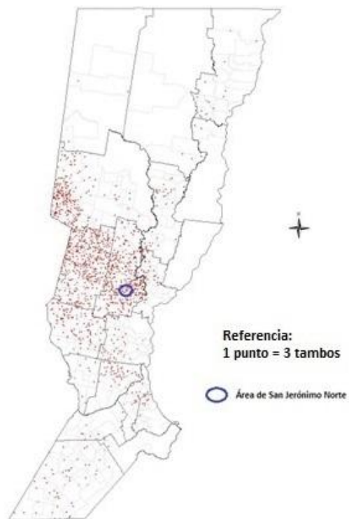
MAPA I: DISTRIBUCIÓN DE LOS TAMBOS EN LA PROVINCIA DE SANTA FE. AÑO 2008.