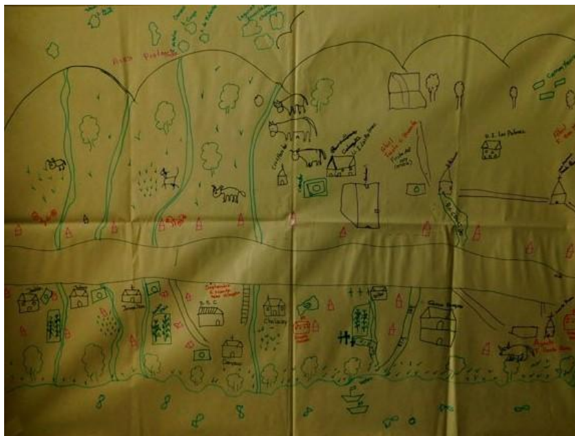
Temporalidades y geo experiencias socio históricas de los actores sociales