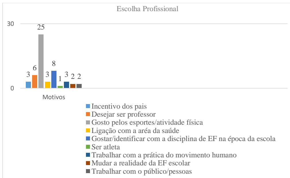
Gráfico 1 - Motivo da escolha profissional dos professores da RMESM na área da EF

Fonte: As autoras, com base nos questionários.