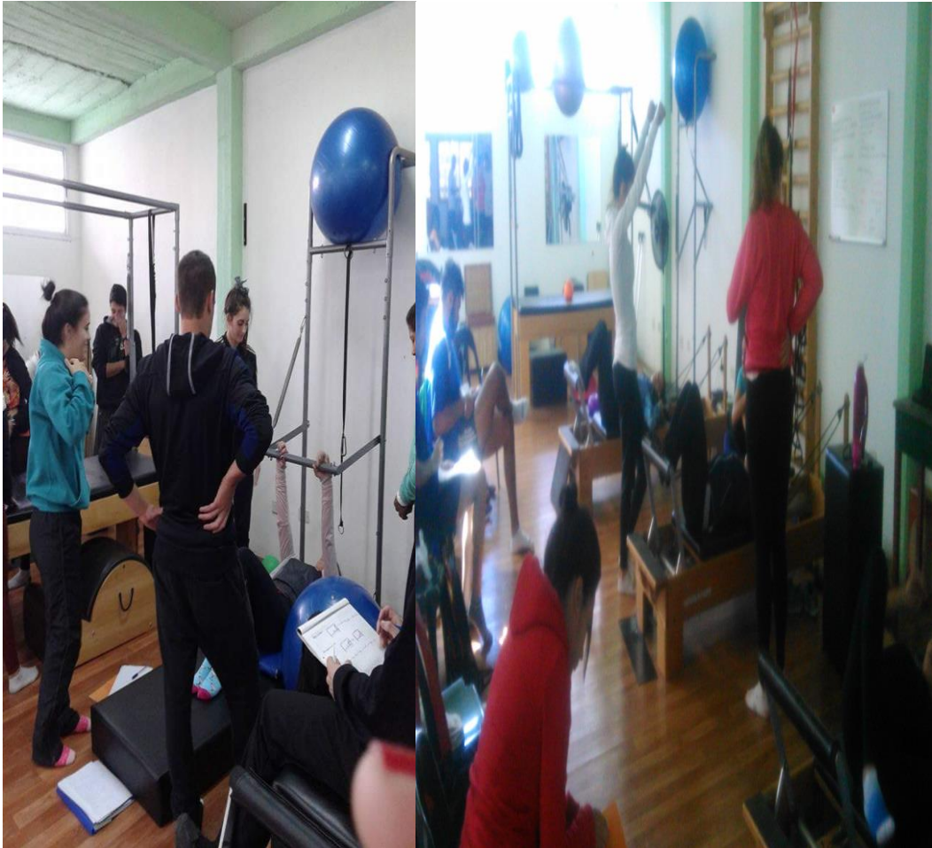
Alumnos de la capacitación trabajando en los diferentes equipos del método.

Se hace hincapié fundamentalmente en el análisis de cada movimiento de los ejercicios, se estudia biomecánicamente las progresiones metodológicas de cada ejecución y los movimientos inconvenientes que podemos llegar a encontrar.