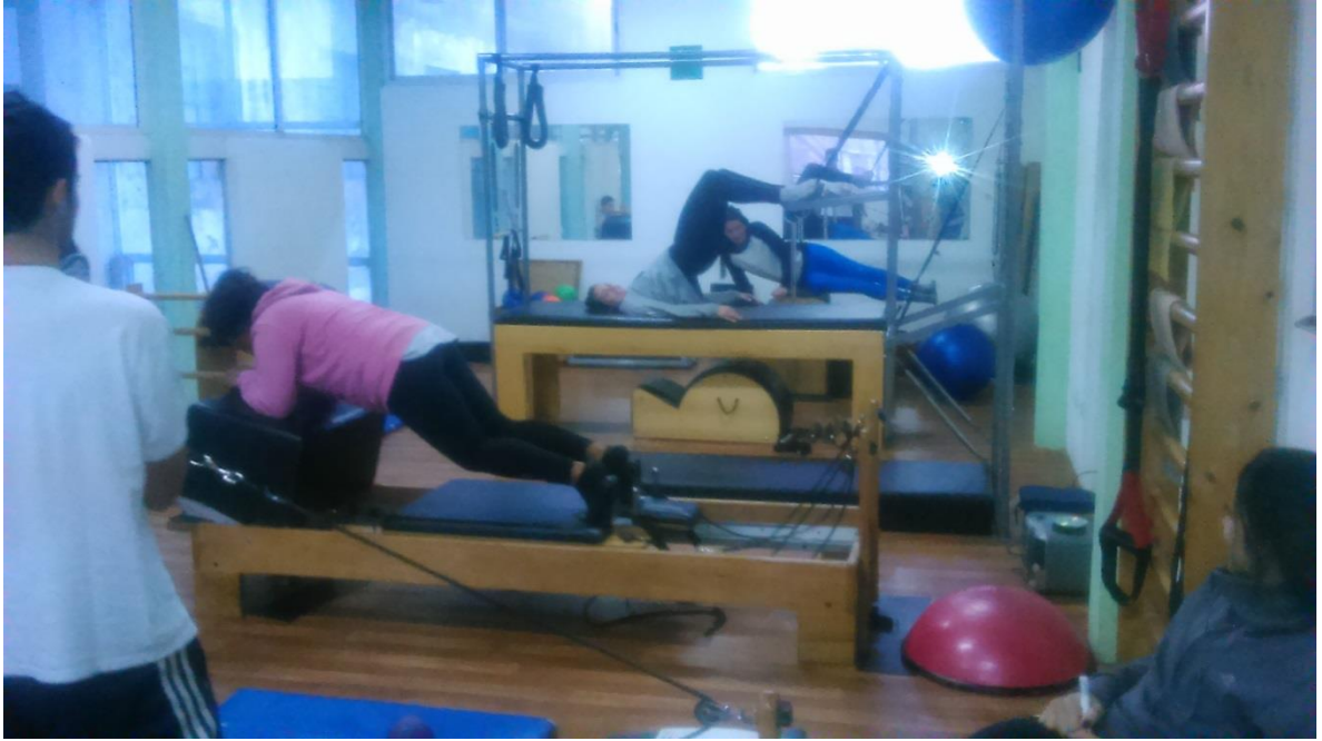
Alumnos haciendo un trabajo en circuito en los equipos del método.