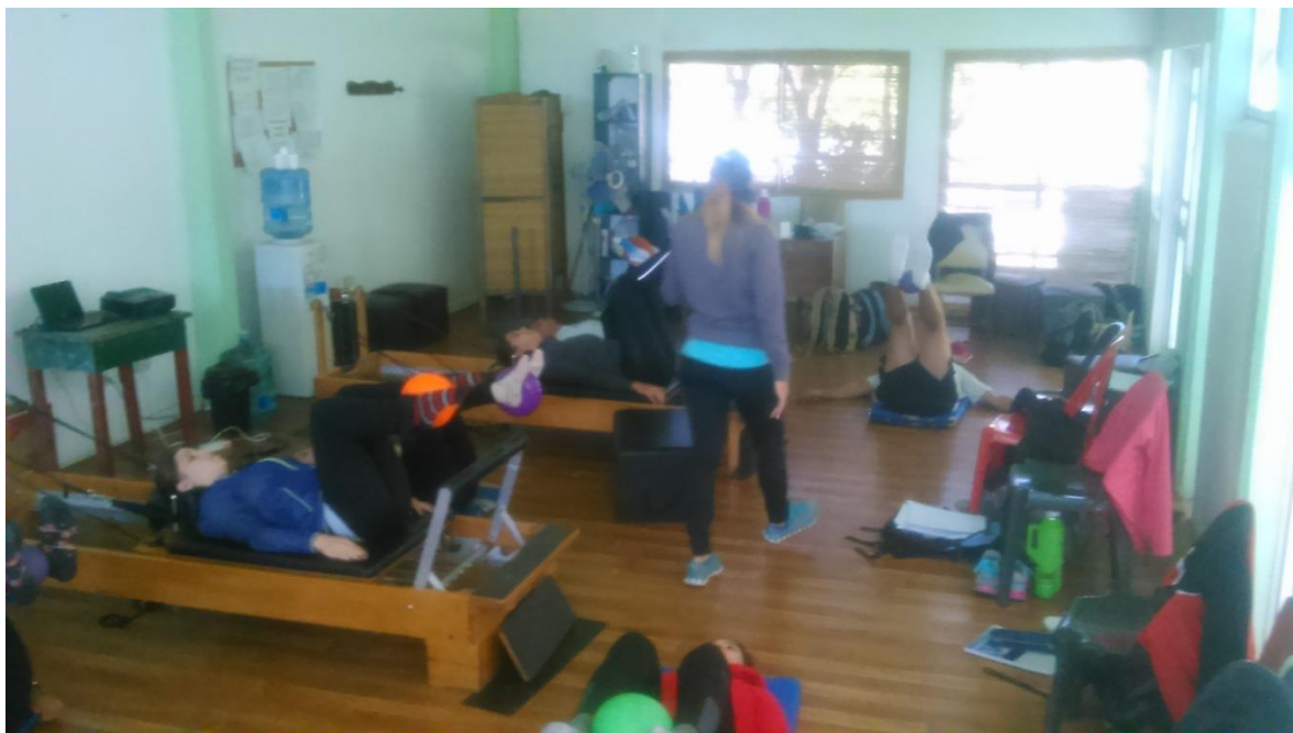
Alumnos del curso realizando ejercicios de entrada en calor con diferentes elementos.

Se comienza con ejercicios característicos de entrada en calor, utilizando diferentes elementos como son: pelotas, mancuernas, banditas, bastones. etc., para luego empezar con ejercicios simples y de esta manera proseguir a más complejos. Esta secuencia se respeta en todos los equipos.