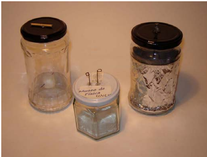
Brújula, electroscopio y condensador

En las siguientes fotografías se aprecian algunos de los instrumentos que propone el cuadernillo: