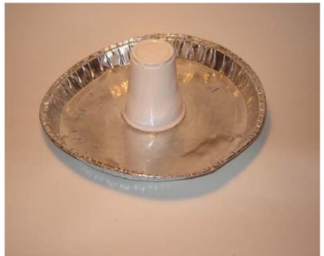
Electróforo de Volta