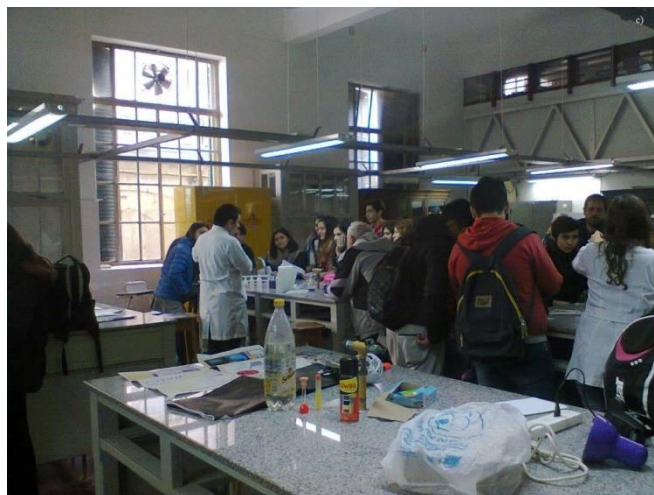
Figura 1: fotografías a) b) y c): Actividades experimentales en laboratorios de la facultad