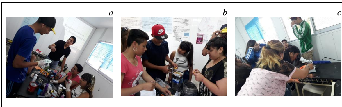
Figura 2. Desarrollo del taller “De la basura a la huerta”. a: Estudiante del Profesorado de Física intercambiando ideas con estudiantes secundarios durante el desarrollo de la actividad de clasificación de residuos. b: grupos de estudiantes secundarios durante la elaboración de microcompostaje. c: Estudiante del Profesorado de Ciencias Biológicas guiando la observación mediante lupa de organismos descomponedores.

lupas de organismos descomponedores; la elaboración de compost para enriquecer la huerta orgánica de la institución escolar; la lectura crítica y el debate sobre cuestiones legales y de impacto económico en la sociedad; la observación de fotografías y videos, así como la elaboración de materiales de divulgación para concientizar a la comunidad a través del diseño de folletos y el armado de una gacetilla para la radio escolar.