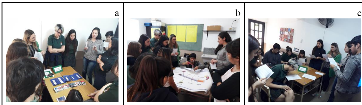
Figura 3. Desarrollo del taller “Bajando los humos”. a: intercambio de ideas acerca de la cadena de comercialización del cigarrillo. b: puesta en acción de un simulador fuma cigarrillos. c: Intercambio de ideas sobre la legislación vigente en torno al consumo de tabaco.

Al culminar la implementación de los talleres se les solicitó a los/as docentes en formación que completaran una encuesta de opinión anónima y en formato on line. Dichas opiniones se describen en el siguiente apartado.