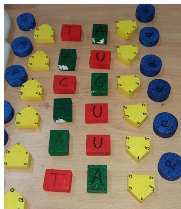
Figura 3. Modelo generado por los estudiantes sobre la secuencia de bases de la cadena de ARNm que se obtiene a partir del segmento indicado de ADN.

d) Identifiquen los codones o triplete presentes en el ARNm y determinen los ARNt que intervendrán en la síntesis del polipéptido en cuestión.