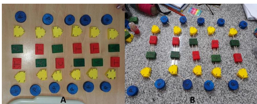
Figura 1. A) Representación de los desoxiribonucleótidos del ADN. B) Modelo de ADN constituido por 5 pares de nucleótidos complementarios.

momento de la clase estuvo destinado a recuperar de forma aplicada o práctica ciertas nociones discutidas en la etapa anterior; para ello se planteó la siguiente cuestión: A partir de las consideraciones teóricas discutidas sobre el tema y valiéndose de las distintas figuras de telgopor que serán entregadas para el desarrollo del Trabajo Práctico: a) Identifiquen cada figura con cada uno de los constituyentes de los nucleótidos. Discutan las principales características de dichas moléculas (Figura 1A). b) Representen los cuatro tipos de monómeros propios del ADN o desoxiribonucleótidos para cada una de las bases nitrogenadas (A, G, C, T). (Figura 1A). c) Considerando las propiedades de la molécula, elaboren un modelo del ADN constituido por 5 pares de nucleótidos complementarios. (Figura 1B)