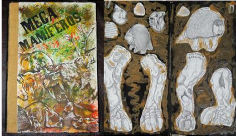
Figura 6. Libro para niños