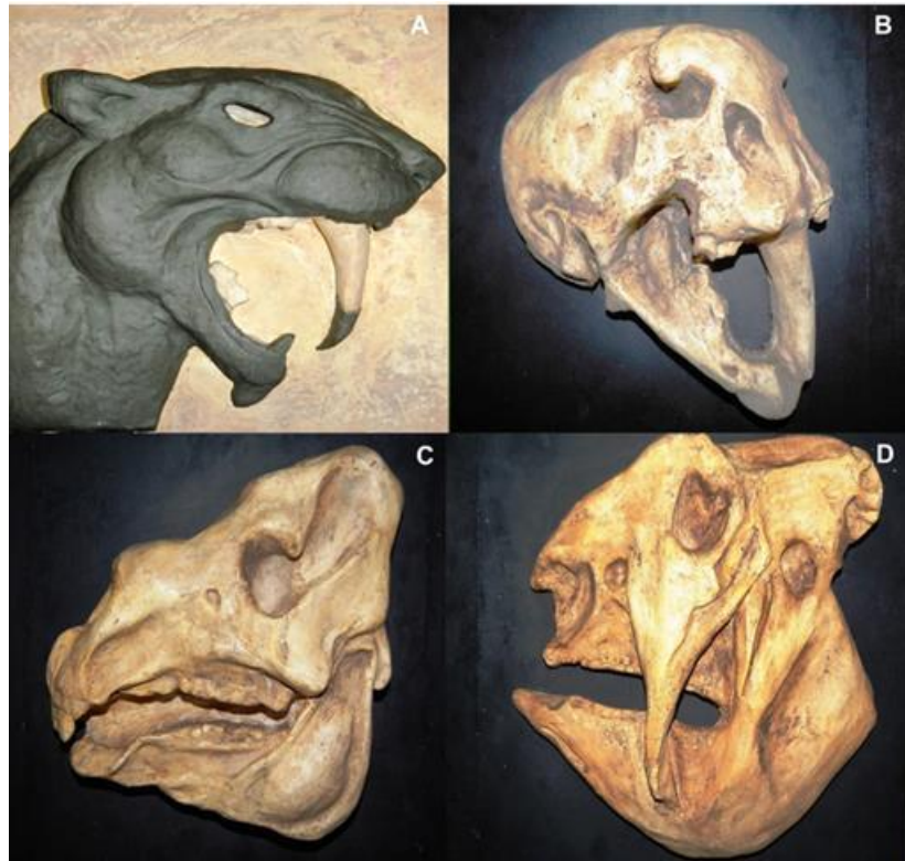
Figura 3: Modelado; A: Reconstrucción musculatura facial de Smilodon, B: Cráneo de Smilodon, C: Cráneo de Toxodon y D: Cráneo de Gliptodonte