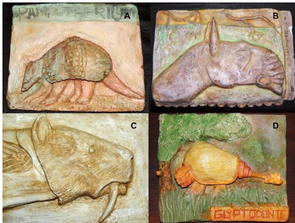
Figura 2: Relieves escultóricos, A: Pampatherio, B: Macrauchenia, C: Smilodon, D: Glyptodon.