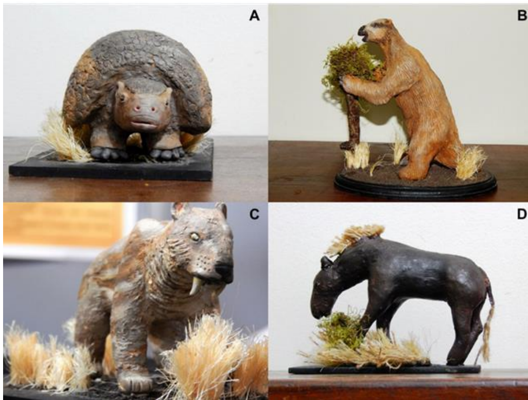
Figura 4: Esculturas, A: Glyptodon, B: Megatherium, C: Smilodon, D: Hippidion.