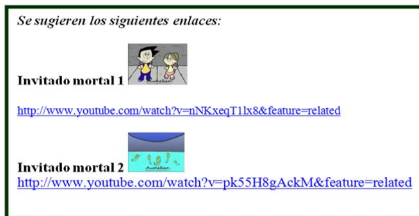
Figura 3. Ejemplo de una actividad de nivel de indagación 1 (de confirmación) (Ministerio de Educación de Córdoba)

La propuesta que diferenciamos de las anteriores correspondió a la provincia de Buenos Aires. Si bien al analizar la introducción no se distinguiría de las otras, fue la que menos indicaciones para los/as docentes presentó, dejando aparentemente mayor libertad para la toma de decisiones acerca de su implementación. Otra singularidad que presentó se relacionó con que las dimensiones sociales aparecieron en muchas de las actividades, incorporándose nuevos componentes no presentes en otros materiales, como las instituciones barriales (“sociedades de fomento, centros de atención primaria de la salud, municipio, centros religiosos, clubes, ONGs, etc.”), que son actores que prácticamente no figuraron en el resto de los documentos. A su vez, los niveles de indagación inferidos de las actividades fueron más altos. En este caso, por ejemplo, se propone que los/as estudiantes “entrevisten a miembros significativos de las instituciones barriales”, para que luego “planifiquen acciones posibles de llevar a cabo en la escuela” y, finalmente, “preparen clases abiertas a la comunidad y para los niños más pequeños de la escuela” (Dirección General de Cultura y Educación de la Provincia