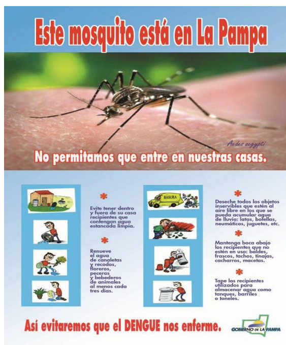
Figura 1. Folleto informativo de La Pampa (Ministerio de Salud de La Pampa)

Con mucha menor frecuencia, en algunos materiales encontramos componentes que relacionamos con la dimensión social, vinculados particularmente con la difusión o el desarrollo de acciones en las comunidades relacionadas con el manejo de criaderos casa por casa. En este sentido, resulta ilustrativo el ejemplo del cómic "Invasión" (Ministerio de Salud de la Nación), donde un grupo de niños y niñas se constituyen en agentes de prevención, "Los Dengadores" (Figura 2), que colaboran "con los agentes municipales en las tareas de descacharrizado y tratamiento de recipientes que acumulan agua".