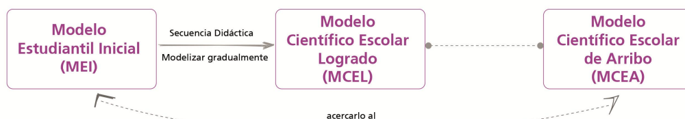
Figura 1: El MCEA se constituye como una hipótesis directriz a alcanzar mediante la secuencia didáctica sustentada en modelos y modelización.

El MCEL, alcanzado al final de la secuencia didáctica, puede ser comparado con el MCEA y con el MEI; logrando saber, entonces, si el modelo postulado como hipótesis directriz (MCEA) de la secuencia didáctica puede ser alcanzado y qué tanto fueron modificados los modelos iniciales de los estudiantes a partir de la misma (Figura 1). De esta manera, podemos validar la secuencia didáctica frente a lo que nos propusimos (MCEA) y no simplemente una transformación de la manera inicial de pensar de los estudiantes.